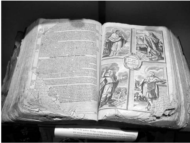
Eine alte, in Schweinsleder gebundene Lutherbibel aus dem 18. Jahrhundert (Archiv der Kirchengemeinde). Sie befindet sich in der Vitrine des Turmzimmers