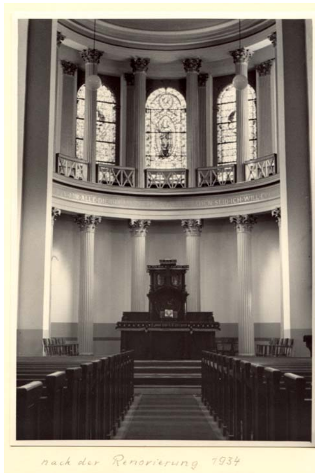
nach der Renovierung 1934 Altarraum nach Innenrenovierung 1934

ment kaum möglich war - eine frühe Erfahrung, die bis heute gültig ist. Die Geschichte des ehrenamtlichen Einsatzes im Bereich der Denkmalpflege, die Arbeitsweise der Vereine und Initiativen zeichnet der Referent am Beispiel des Rheinischen Vereins für Denkmalpflege und Heimatschutz nach: vom hochherrschaftlichen Impetus der Kaiserzeit bis zur Umweltschutzbewegung der sechziger Jahre.