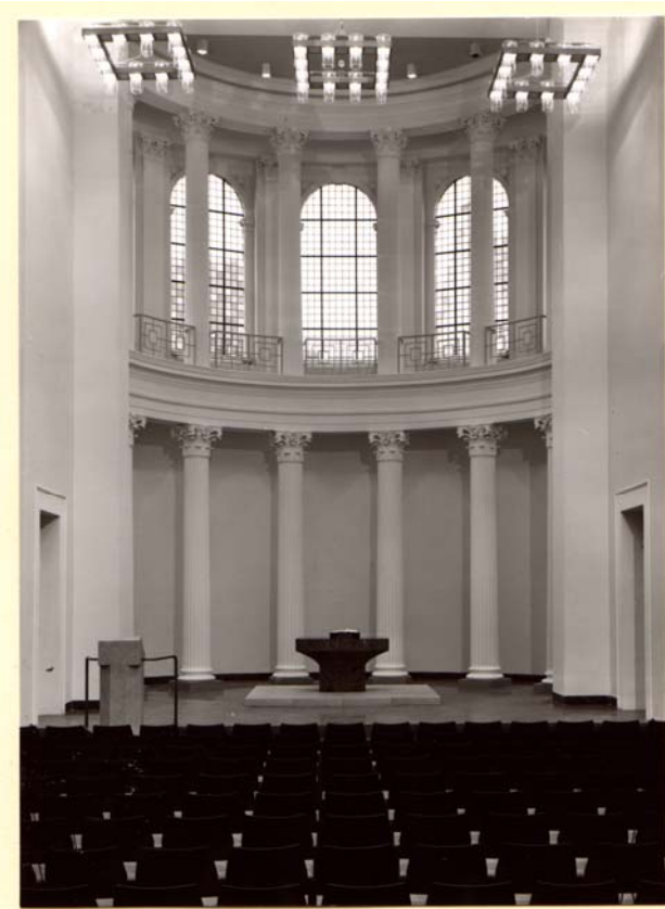
Altarraum nach Innenrenovierung 1967

und Bürger, denen wir für ihren bisherigen Einsatz ganz herzlich danken“ sagt Becker.