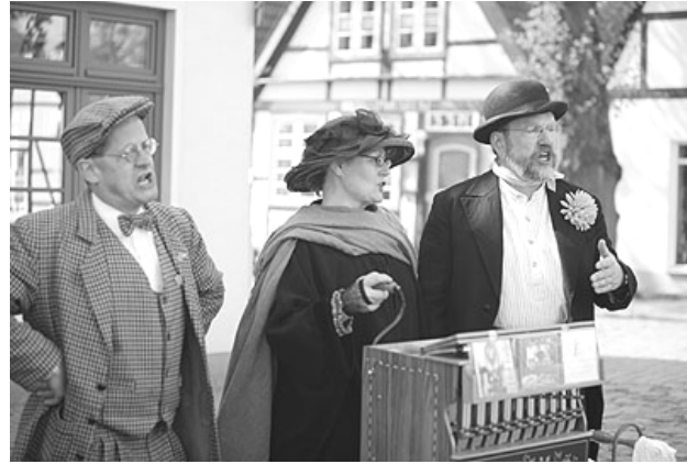
Leierkastenheiterkeit beim Drehorgelfestival

Am 3. März 2007, 17.00 h, wird präsentiert das Duo „ Leierkastenheiterkeit “ sein Programm „Von Bach zu Brubeck“. Auch dieses Konzert findet